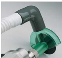
El sistema completo CC4A

Manguera Nro. de pieza 67682 Campana Nro. de pieza 600003 Codo Nro. de pieza 2920