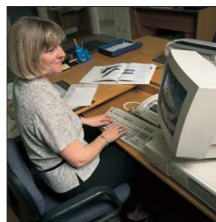
Proceso de pedidos de ventas