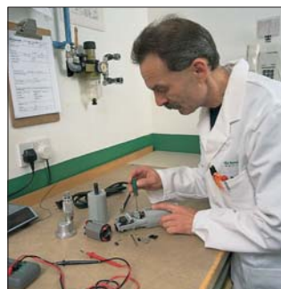
Servicio postventa y reparaciones

Cada una de las sierras para yeso De Soutter Medical está concebida para brindar muchos años de uso sin problemas. Este compromiso con la durabilidad de los productos está respaldado por una garantía de 12 meses "no nonsense" ("sin excusas absurdas") y es apoyado por un centro de reparaciones moderno y de "vía rápida".