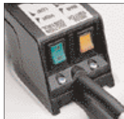
Interruptor de extracción de dos velocidades