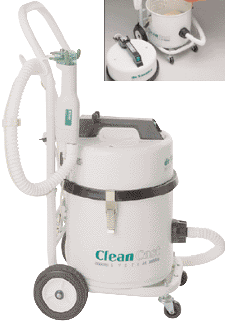
El sistema completo CC5A

El extractor tiene un sistema de filtración de cuatro etapas compuesto de una bolsa colectora de papel fácil de limpiar, dos filtros de tela y un micro filtro, el cual retiene el 99,997% de todas las partículas de polvo mayores de 0,5 micrones.