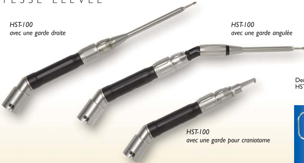
HST-100 avec une garde pour craniotome