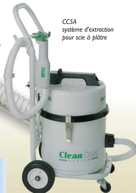
CC5A système d'extraction pour scie à plâtre

Demandez le catalogue des instruments pour scie à plâtre n° 113