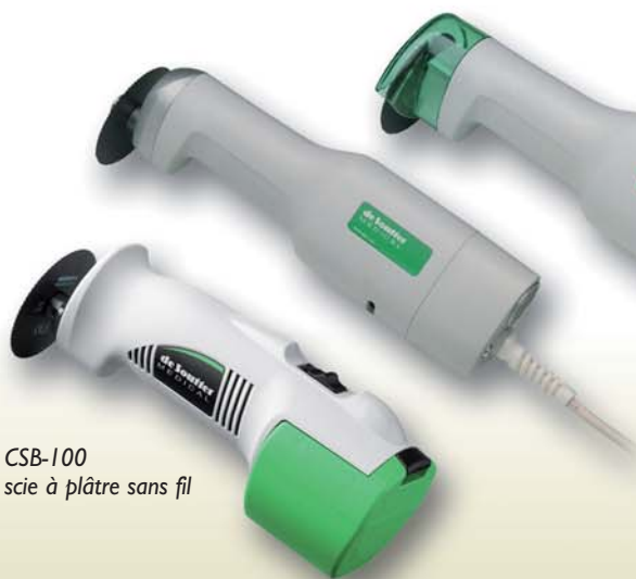
CSB-100 scie à plâtre sans fil