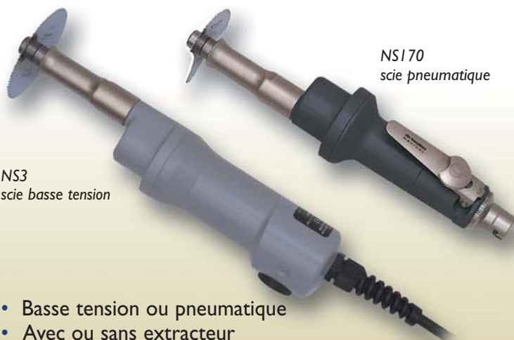
NS3 scie basse tension