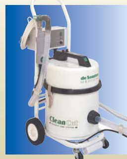
CNS3A Scie et Système d'extraction

Demandez le catalogue de la scie pour autopsie n° 116.