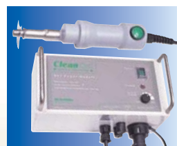
NS3A Scie et module d'alimentation